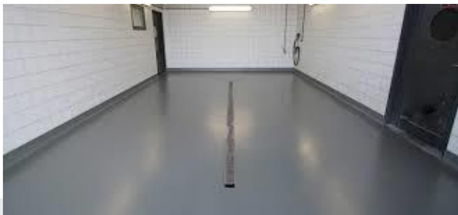
Foto: Voorbeeld kunstharsgebonden voorziening.