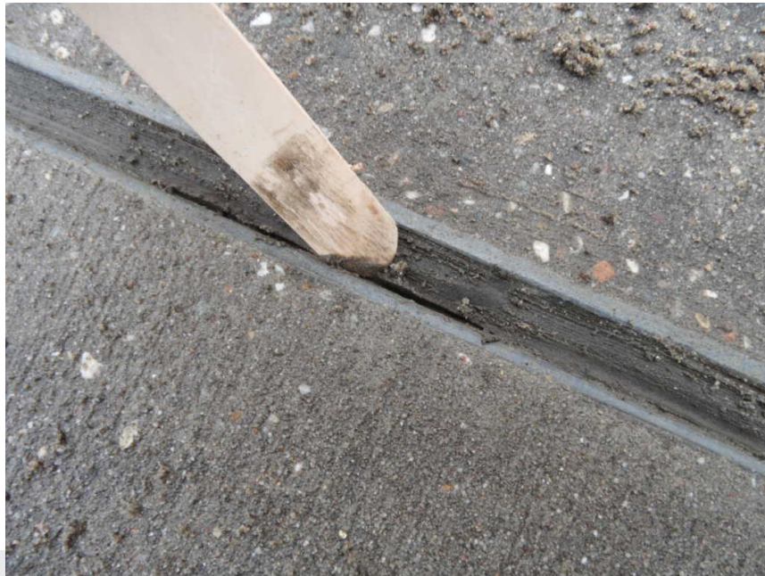
Foto: Afdichting is onthecht.