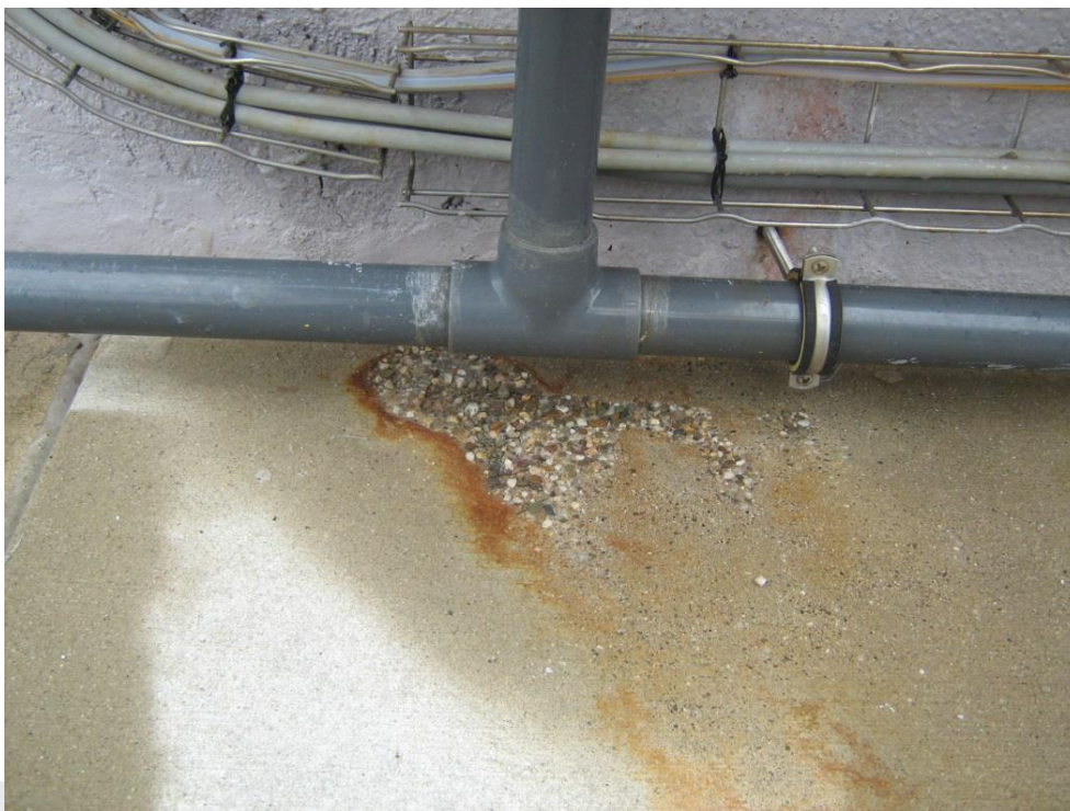
Foto: Voorbeeld van chemische aantasting.

Door kloppen of strijken met een hiervoor geschikt gereedschap kan de DI vaststellen of volledige hechting aanwezig is.