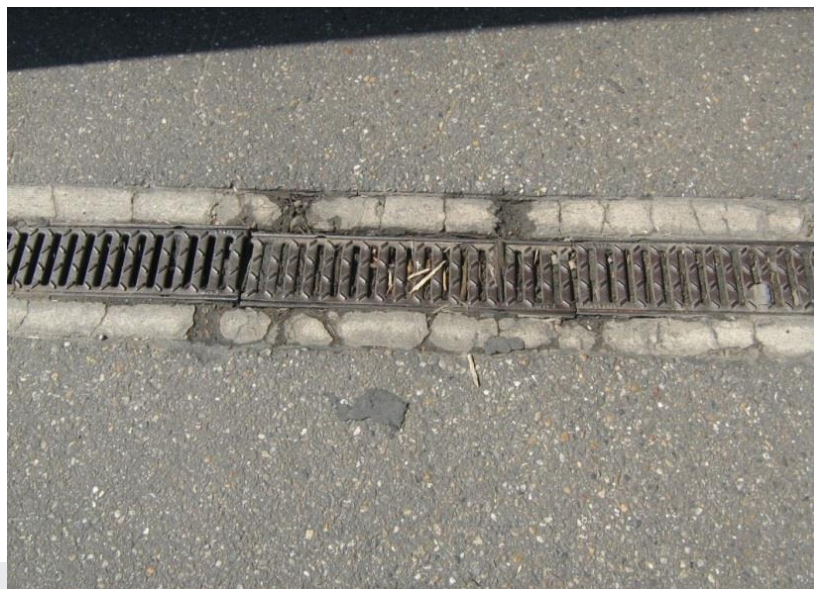
Foto: Aansluiting met lijngoot die niet vloeistofdicht is afgewerkt.

De DI kan ook door nader onderzoek de vloeistofdichtheid onderzoeken van lassen, (stort)naden en aansluitingen (zie hoofdstuk 4).