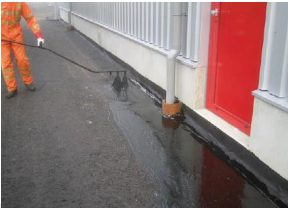
Foto: Voorbeeld kritieke plaats ter plaatse van aansluiting.