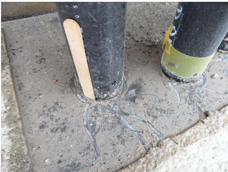
Foto: Voorbeeld van een niet-afgedichte doorvoer.

Bij doorvoeren in de voorziening beoordeelt de DI visueel of vloeistoffen langs of door de doorvoeren – eventueel voorzien van een afdichting met voegvullingsmassa of een pakking – de niet-belaste zijde bereiken of kunnen bereiken.