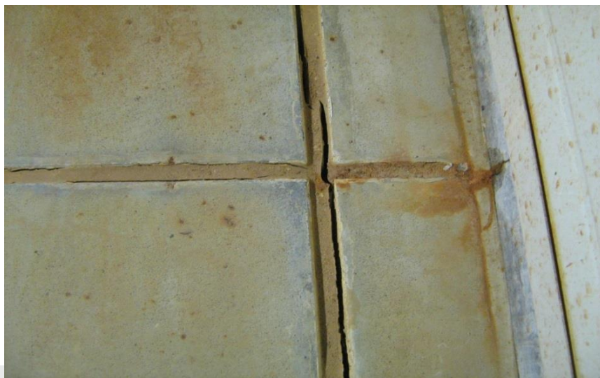
Foto: Beschadigde kitvoeg.

Een voegvullingsmassa of een afdichtingsprofiel kan gescheurd en/of beschadigd zijn. De DI merkt dit aan als een onvolkomenheid, tenzij de scheur of beschadiging over de volledige hoogte van de vulling of afdichting aanwezig is. Een scheur of beschadiging over de volledige hoogte van de vulling of afdichting is een gebrek.