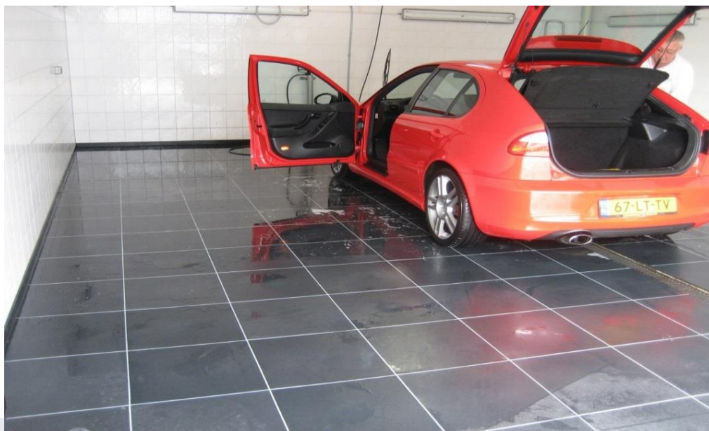
Foto: Vloer uitgevoerd met kunststof elementen.