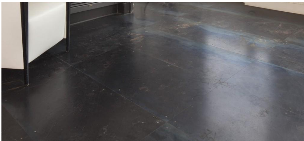
Foto: Voorziening van aan elkaar gelaste metaalplaten.