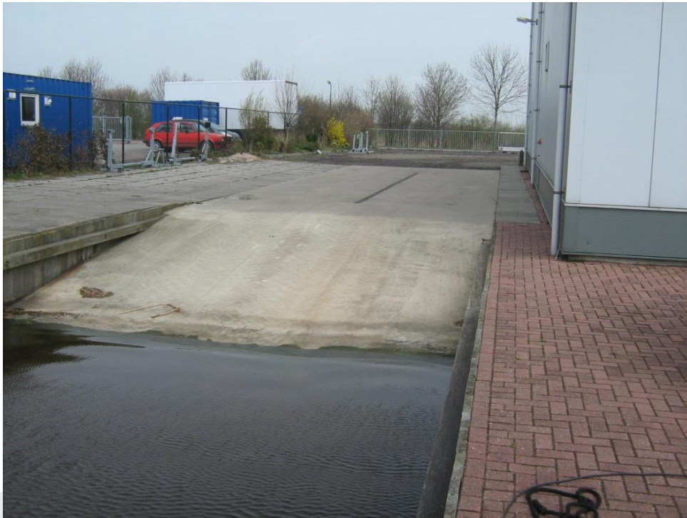
Foto: Voorbeeld van een aandachtspunt bij afschot richting oppervlaktewater.