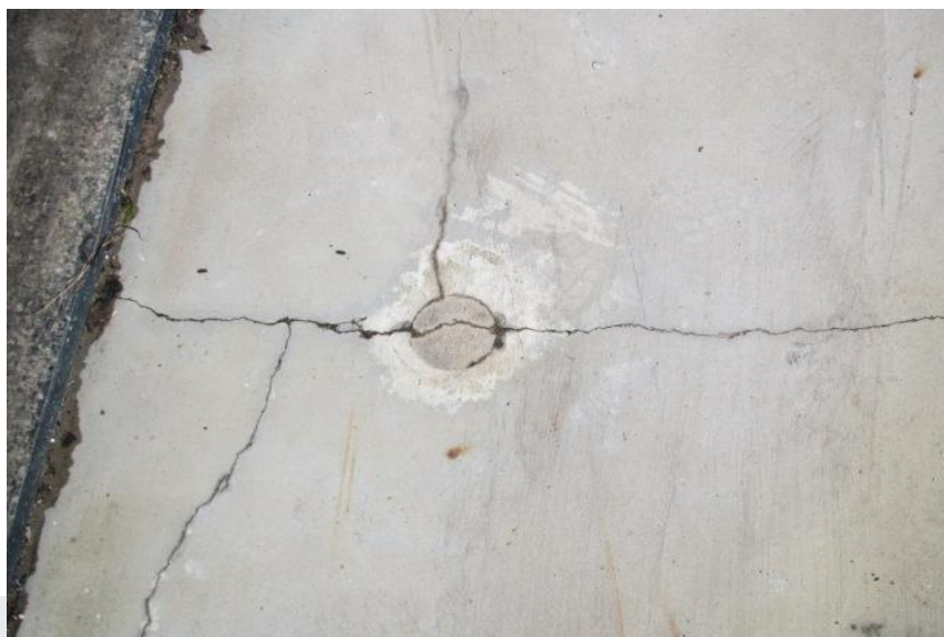
Foto: Voorbeeld van scheur.

De DI beschrijft scheuren en/of breuken en/of legt deze vast op een inspectietekening.