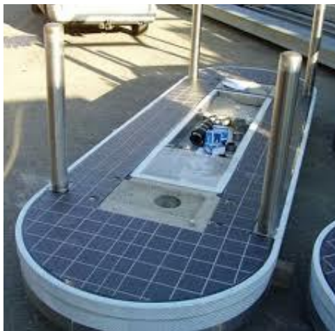
Foto: Pompeiland voorzien van tegels.