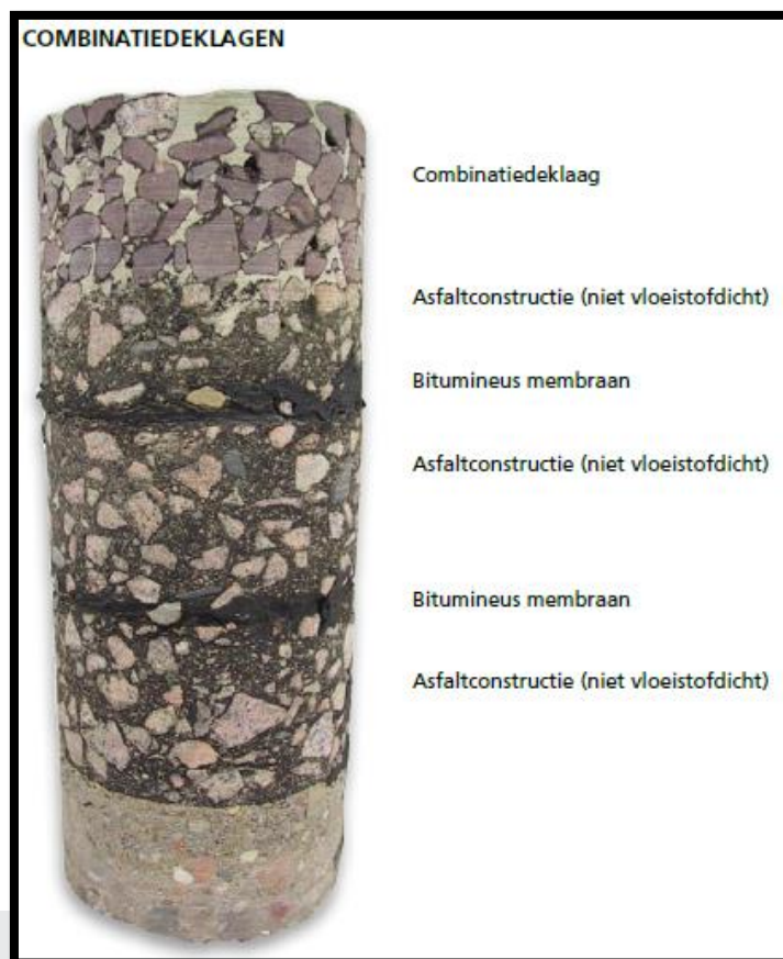
Foto: Voorbeeld van de opbouw van een combinatiedeklaag (bron: VBW Handleiding vloeistofdichte bitumineuze constructies).