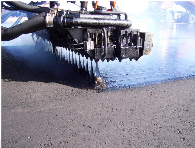
Foto: Aanleg vloeistofdichte asfaltconstructie.